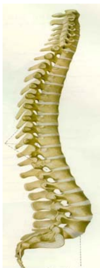
Figuur 1: de wervelkolom

De wervelkolom is opgebouwd uit zeven nekwerfels, twaalf borstwerfels, vijf lendenwerfels, het heiligbeen (sacrale werfels, vergroeid) en het staartbeen (coccygeale werfels, vergroeid), zie ook figuur 1. Tussen de werfels liggen de tussenwervelschijven. Deze zijn belangrijk voor de beweeglijkheid van de wervelkolom en vangen onder andere schokken op. Het ruggenmerg bevindt zich in het wervelkanaal, dat als een holle buis in de wervelkolom ligt. Het ruggenmerg geeft ter hoogte van iedere wervel twee zenuwwortels af, waarbij er steeds één links en één rechts tussen de werfels door het wervelkanaal verlaat.